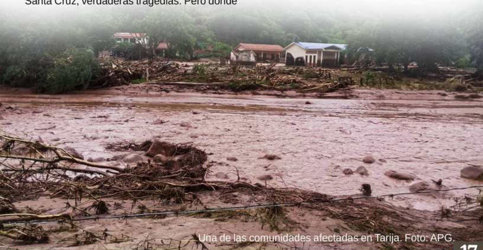
Una de las comunidades afectadas en Tarija.